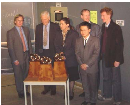
Ngô Bảo Châu tại buổi lễ trao Giải thưởng Clay (GS Laumon đứng ngay sau anh)

Giáo sư: Ngô Bảo Châu (ĐH Paris 11) do Viện Toán học đề cử.